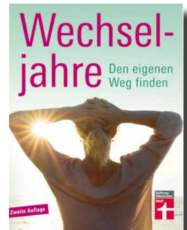
Bopp A (2016) Wechseljahre. Den eigenen Weg finden (2. Aufl.), Berlin: Stiftung Warentest, 191 S., 19,90 €

Andererseits ist es keine Frage, dass unregelmäßige Blutungen, stärkere Hitzewellen oder Schlafprobleme im Alltag lästig sind. Was dahintersteckt, erklärt das Kapitel „Zyklus und Hormone“. Und was frau selbst ausprobieren kann, wird in dem Kapitel „Du bist nicht alleine ...“ beschrieben. Dabei geht es etwa um den Austausch mit anderen Frauen, um Kleiderfragen (Zwiebeltechnik) und pflanzliche Präparate. Zu diesen hat GPSP allerdings eine kritischere Einstellung als die Stiftung Warentest, die aber